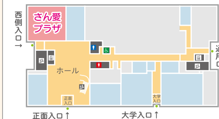
佐賀メディカルセンタービル1F